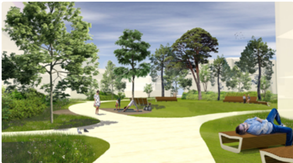
© Agence Trouillot & Hermel paysagistes

La Fab est en charge de la mise en œuvre opérationnelle du programme Habiter, s'épanouir - 50 000 logements accessibles par nature.