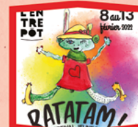
FESTIVAL RATATAM !