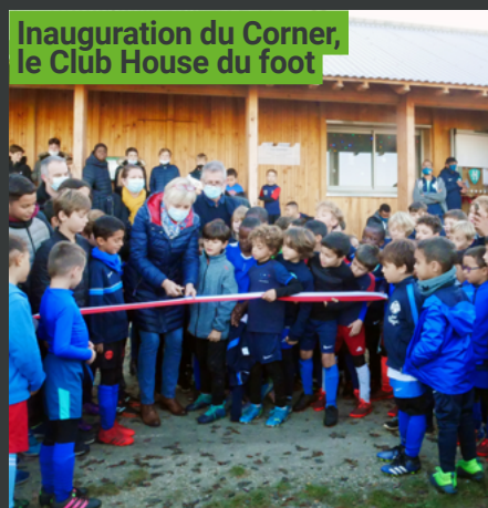
Inauguration du Corner, le Club House du foot