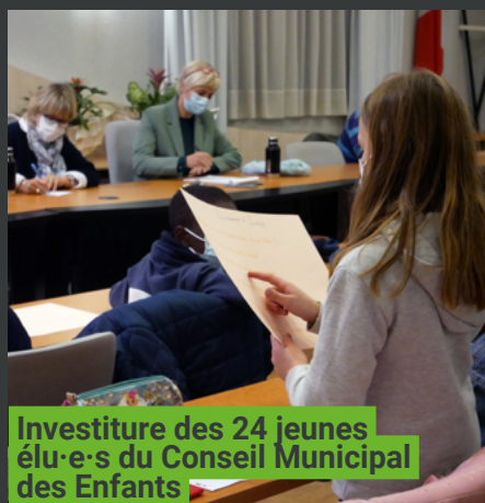
Investiture des 24 jeunes élu-e-s du Conseil Municipal des Enfants