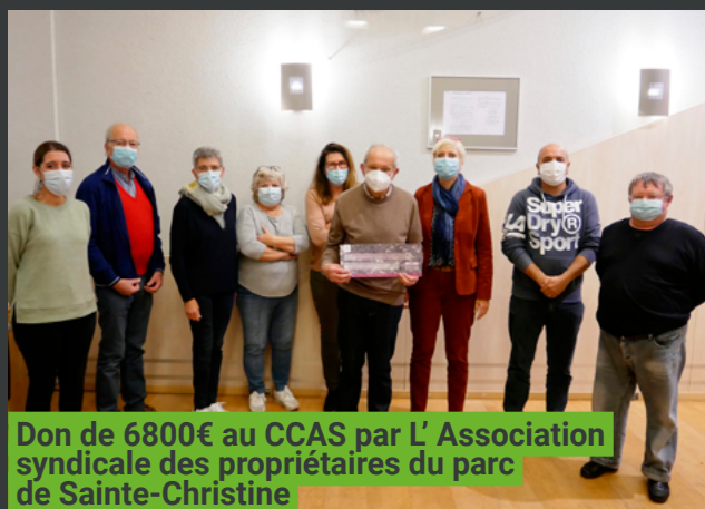
Don de 6800€ au CCAS par L' Association syndicale des propriétaires du parc de Sainte-Christine