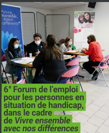
6 e Forum de l'emploi pour les personnes en situation de handicap, dans le cadre de Vivre ensemble avec nos différences