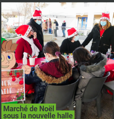
Marché de Noël sous la nouvelle halle