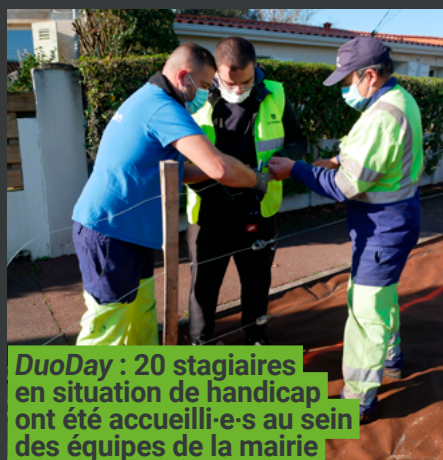
DuoDay : 20 stagiaires en situation de handicap ont été accueilli-e-s au sein des équipes de la mairie