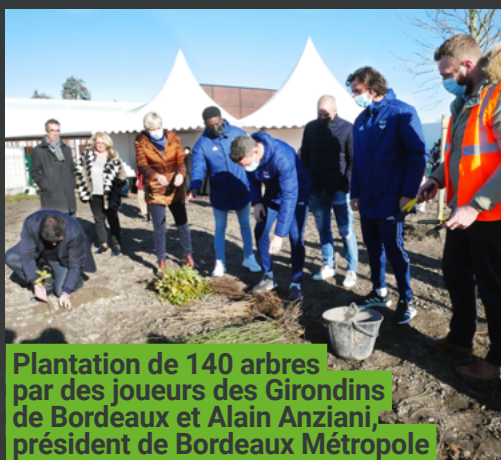
Plantation de 140 arbres par des joueurs des Girondins de Bordeaux et Alain Anziani, président de Bordeaux Métropole