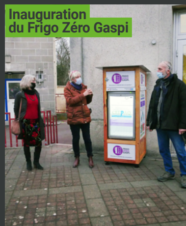
Inauguration du Frigo Zéro Gaspi